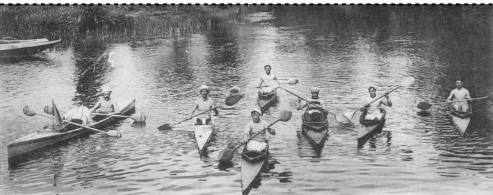
OLIVET. — Périssoires de la Société Nautique du Loiret.

Librairie du Loiret - Maume Vernedal, edit. — Orléans